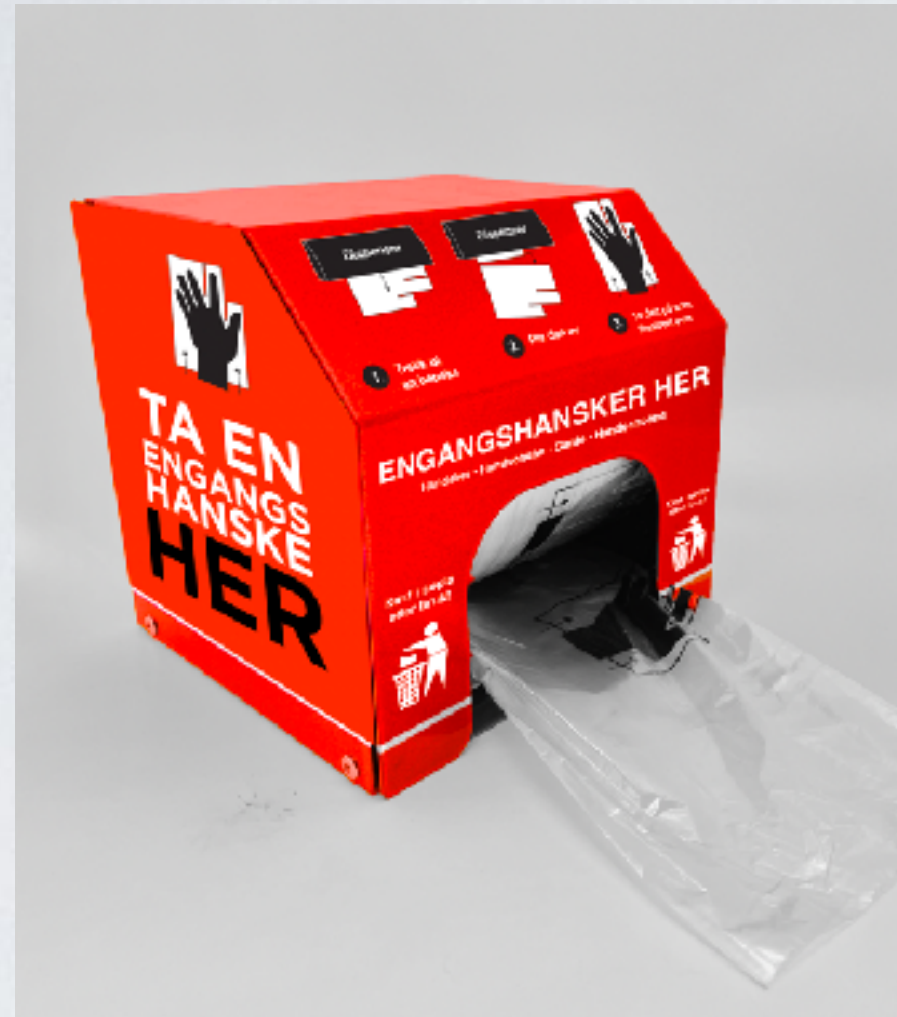
Robust låsbar dispenser