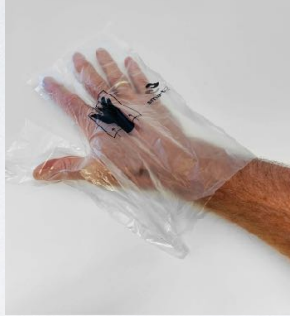
One size fit all