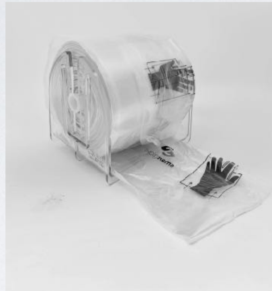
Et unikt bremsesystem 1000 hansker pr. Rull