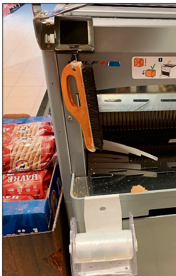
SMART: Ideen unngår søl og sparer kundene for tørt brød.

- Vi jobber for øvrig kontinuerlig med å finne nye produkter som effektiviserer, forenkler, er kostnadsbesparende eller bidrar til økt omsetning for en butikk, forklarer Bremnes og viser oss firmaets katalog som inneholder en rekke produkter som de i dag leverer til dagligvare-